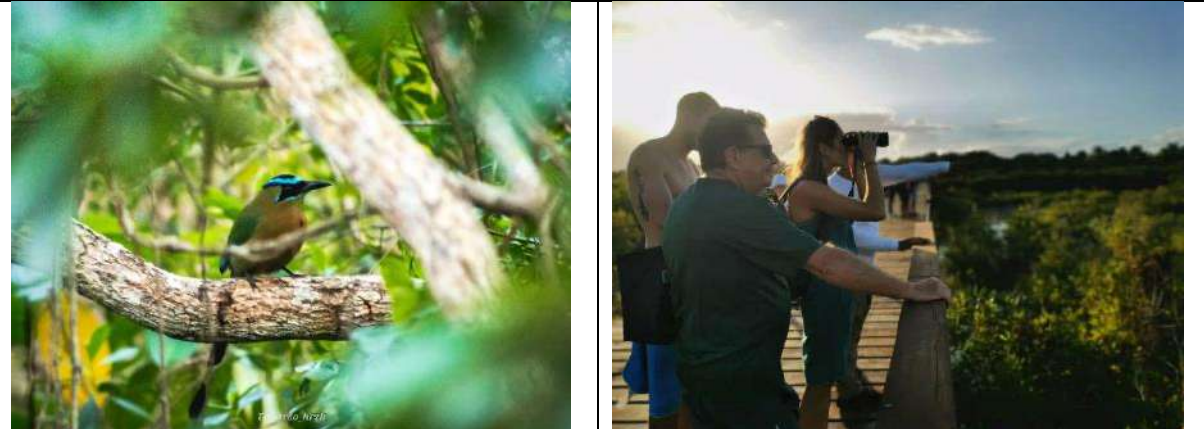
Fig. Monitoreo de aves en el Parque Ecológico Estatal Laguna de Bacalar