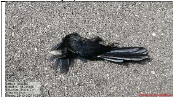
Fig. Garrapatero Pijuy

Registro de Fauna atropellada camino Calderitas - Luis Echeverría - Laguna Guerrero, con un total de 245 individuos pertenecientes a 54 especies ( Loro yucateco, Paloma aliblanca, Ave sin identificar, Ratón de monte yucateco, Culebra alacranera de sangre, Pavo, Gato, Perro, Serpiente cola negra, Serpiente tigre / voladora, Cabezón degollado, Culebra bejuquilla verde, Iguana rayada gris, Tlacuache común, Ardilla yucateca, Murcielago, Puercoespín, Basilisco rayado, Sapo gigante, Chachalaca, Gallina de patio, Pájaro carpintero, Sapo común, Libelula verde, Sapo excavador mexicano, Culebra caracolera, mariposas de la familia Nymphalidae, tarántulas, libeludas del orden Odonata, Serpiente ojos de gato, Serpiente cascabel yucateca, Codorniz yucateca, Tarántula de panza roja, Serpiente terciopelo Nauyaca, Serpiente, Iguana verde común, Ameiva arcoíris, Culebra bejuquilla marrón).