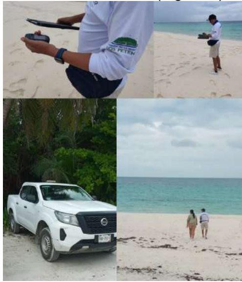
Figura 4. CONANP evaluación de señalética.

la propuesta para la convocatoria de Marfound (Figura 4).