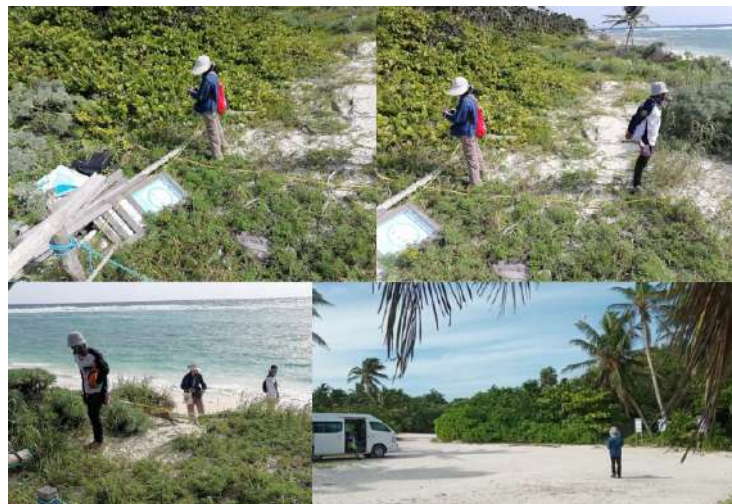
Figura 8. Monitoreo de duna costera.

El 04 de diciembre, el equipo de la Dra. Gabriela Mendoza González realizó el monitoreo de la playa con la finalidad de evaluar las condiciones de crecimiento de la duna costera en el ANP; dicho monitoreo fue realizado por un grupo de la Universidad Autónoma de México (UNAM), extensión Unidad Multidisciplinaria Sisal (UMDI Sisal) (Figura 8).