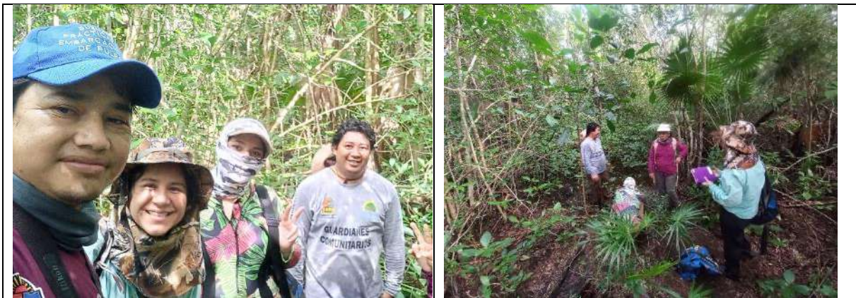
Fig. Salida de prospección en el ejido Calderas de Barlovento y Tollocan del Proyecto “Paleoclima y Carbono en sedimentos de Humedales de la Península de Yucatán”