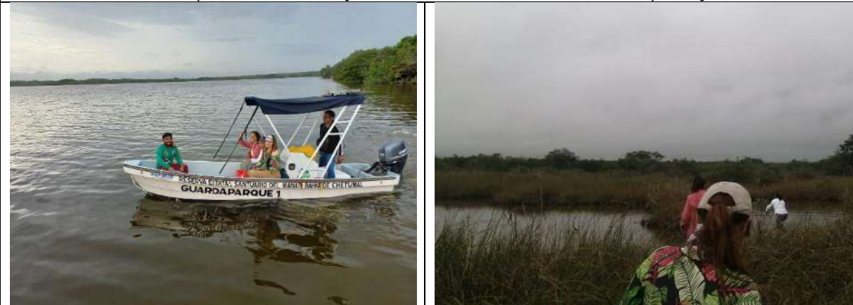
Fig. Salida de prospección en el ejido Laguna Guerrero del Proyecto "Paleoclima y Carbono en sedimentos de Humedales de la Península de Yucatán"