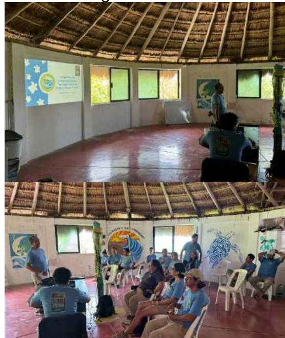
Figura 3. Reunión mensual de Tortugueros de FFCM A.C.

competencia estatal con criterios de valorización de servicios ecosistémicos. El santuario no posee un programa de monitoreo interno, no obstante, brinda las facilidades a centros de investigación para realizar estudios en el área cuando así lo soliciten. Con dicha colaboración, el santuario recaba información de distintos temas. El 02 de octubre se llevó a cabo la reunión mensual de Tortugueros de Flora, Fauna y Cultura de México, esta reunión tuvo sede en las instalaciones del campamento Tortuguero del Santuario de la Tortuga Marina Xcacel-Xcacelito (Figura 3).