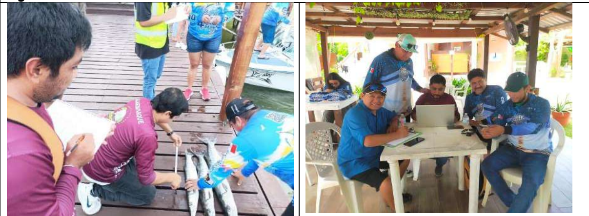
Fig. Monitoreo Pesquero de los Tornos: IV Torneo de Pesca Restaurant Riveros Bahía de Calderitas y 3º Torneo de Pesca Deportiva de Orilla by "KING FISH", en la modalidad de captura y liberación.