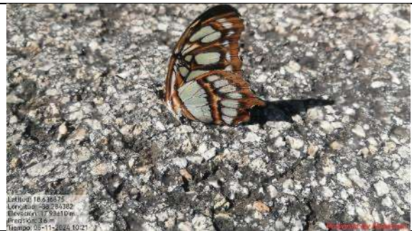
Fig. Mariposa verde de malaquita