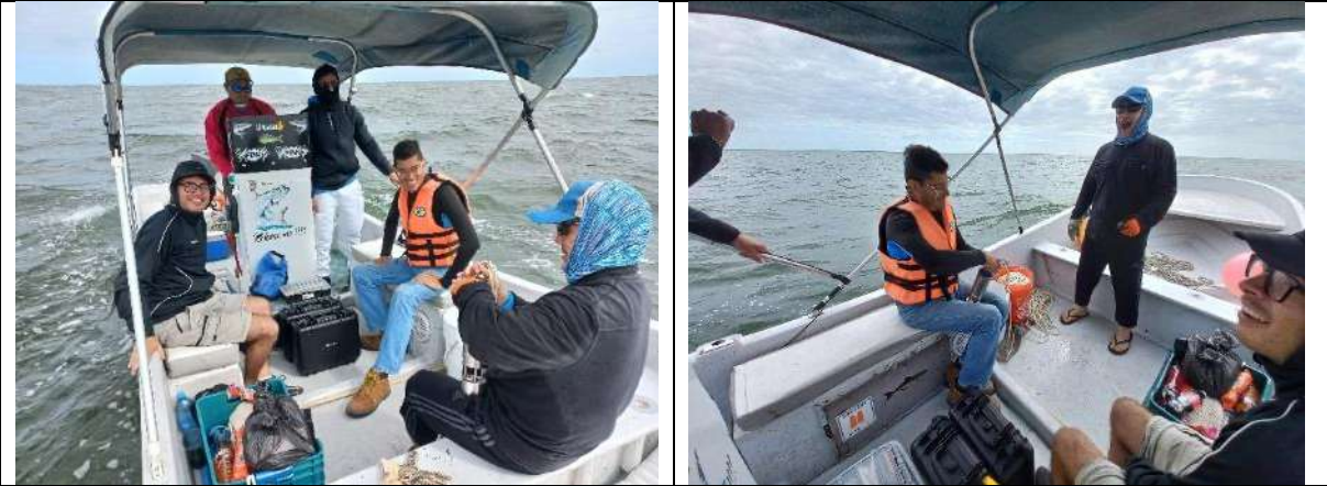
Fig. Monitoreo Pozas ECOSUR