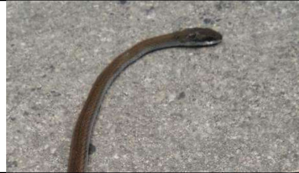
Fig. Serpiente lagartijera