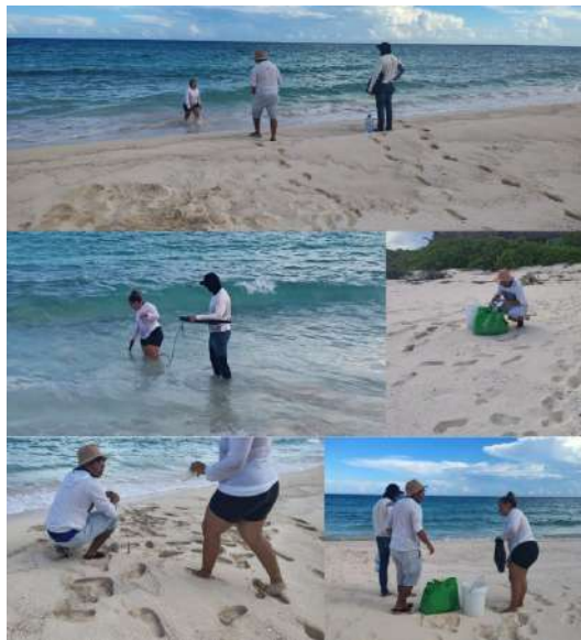
Figura 5. Muestra de agua y sedimento.