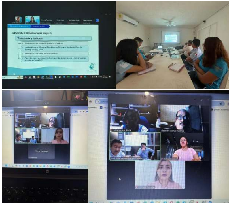
Figura 7. Reuniones de MARFUND.