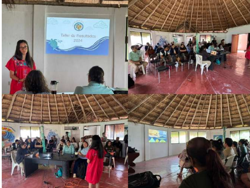
Figura 9. Reunión estatal de tortugeros de Quintana Roo.

anidación en el estado y sus diferentes progresos en relación con su protección, al igual que diferentes de estudio y/o investigación entre otras cosas (Figura 9).