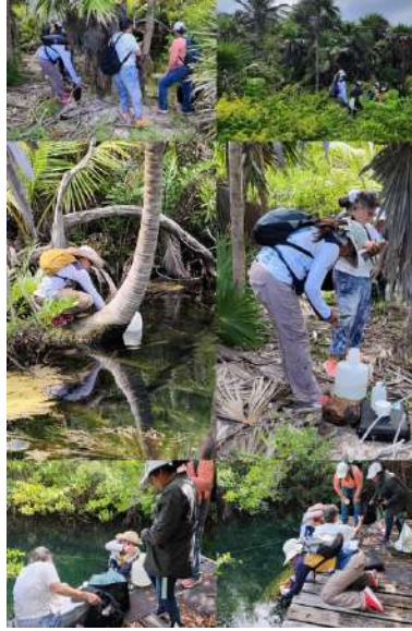
Figura 6. Toma de muestra de agua de cenotes de Xcacel y Xcacelito.

En el cuarto trimestre de octubre-diciembre se identificaron un total de 384 nidos de tortuga Caguama ( Caretta caretta ) a lo largo de la bahía de Xcacel y Xcacelito, siendo octubre el mes con mayor porcentaje de nidos, de igual forma se reportó un número de 14,437 crías nacidas e incorporadas al mar. Mientras que tortuga Blanca ( Chelonia Mydas ) tuvo un total de 2,747 nidadas y un total de 131,253 crías nacidas siendo también octubre el mes con mayor cantidad de nidos y crías. Estos números se deben al término de la temporada de anidación del 2024.