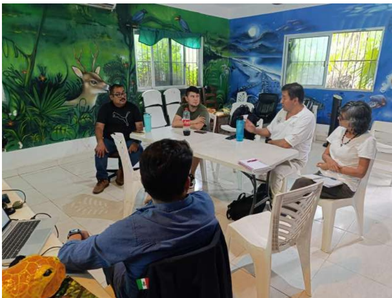
Figura 11. Reunión con Guardianes comunitarios Chemuyil y CONANP.