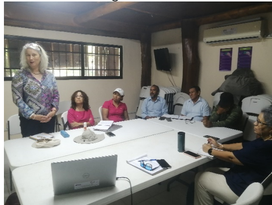
Fig. Participación en la Visita y Evaluación del Proyecto "Desarrollo sustentable de regiones costeras urbanas mediante la integración de servicios ecosistémicos y biodiversidad (BIOCITIS)"