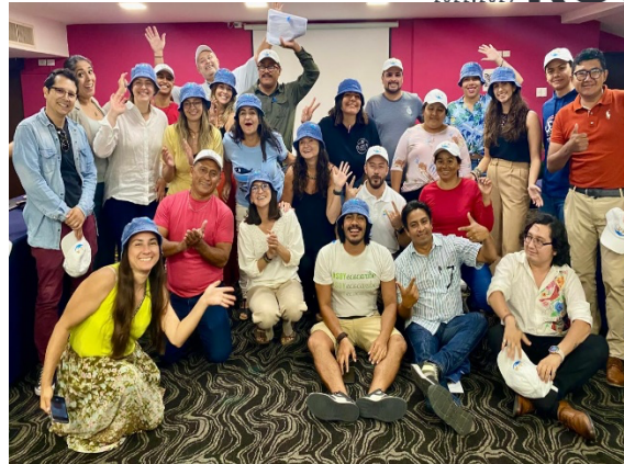
Fig. Encuentro de las tres generaciones de Kaambal Suut