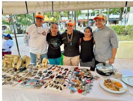
Fig. Alianza con Xcal'arte para participar en el festival del pez león en Cozumel.