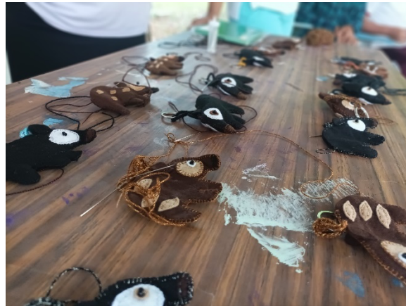
Fig. Actividades del día del Tapir con la primaria Benito Juárez de Laguna Guerrero