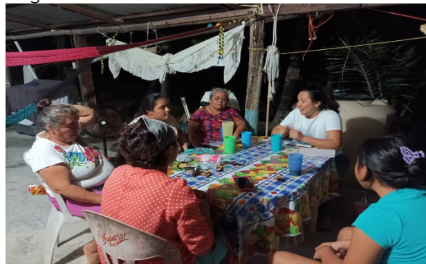
Fig. Reunión interna de trabajo.