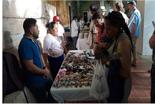
Fig. Simposio Internacional de la Sociedad Americana de Aracnología