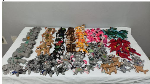
Fig. Pedido de 120 recuerdos alusivos al 30 aniversario del PPD.