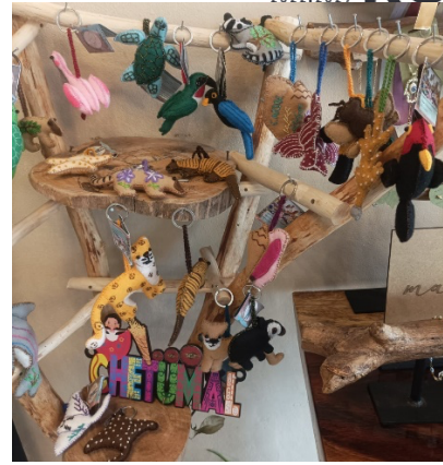
Fig. Venta de producto en el local de artesanías de Mazorca Negra en Chetumal.