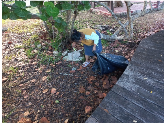
Fig. Actividad de Limpieza en el Área del Balneario del ejido Úrsulo Galván.