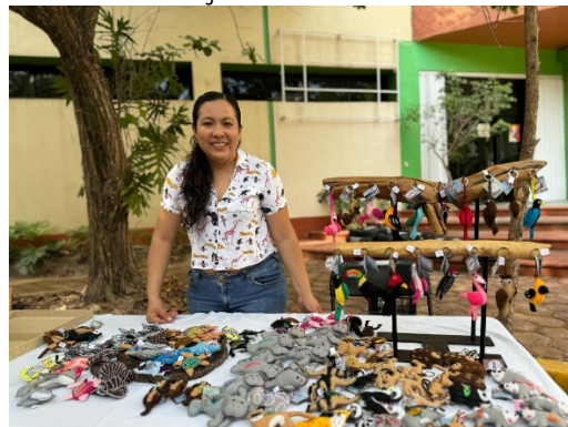
Fig. Participación en el tianguis de ECOSUR a puertas abiertas.